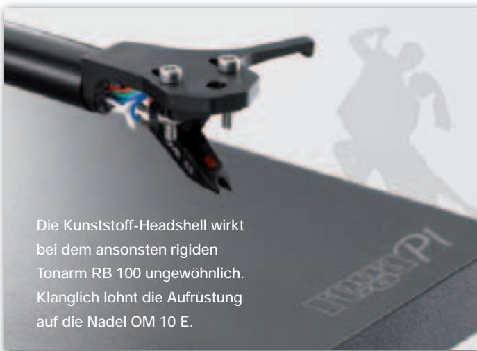
Die Kunststoff-Headshell wirkt bei dem ansonsten rigiden Tonarm RB 100 ungewöhnlich. Klanglich lohnt die Aufrüstung auf die Nadel OM 10 E.

Dies änderte nichts daran, dass der Planar 1 auch in der Standardversion ein stereoplay Highlight für seine mitreißende Musikalität bekam und so ein heißer Tipp für alle ist, die viel Musik für wenig Geld suchen.